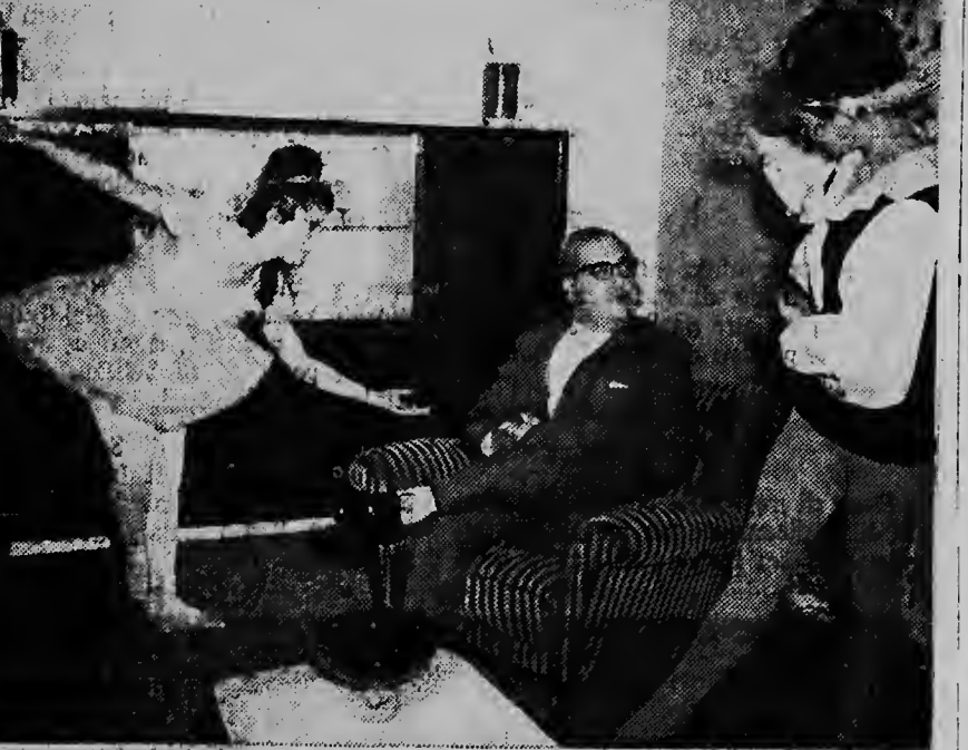
Na un manera extraordinario octavo vakbeurs pa meubel i textiel di cas a keda inaugura cu un grupo di baliador di ballet infantil largando Drs. Wijsen sorprendi.